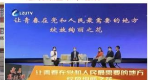
思政课走进“抗疫精神”