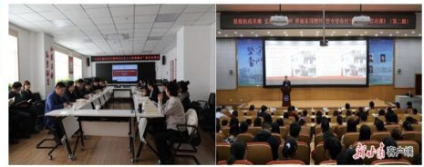
“习近平新时代中国特色社会主义思想”概论课集体备课会 兰州大学“我与思政课”共忆抗疫斗争 汲取精神力量