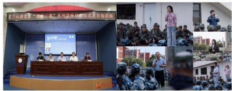
兰山讲堂·思政云课 “别样思政”走进军训场