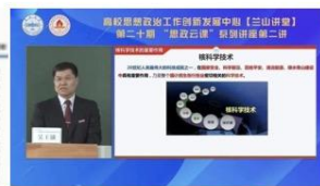
开展课程思政云直播