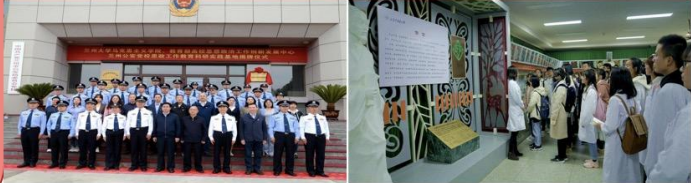
联合创建研学基地