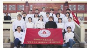
思政课走进“八步沙”