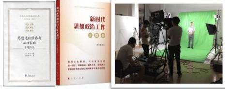
联合攻关编写出版教辅讲义 精心录制思政课慕课