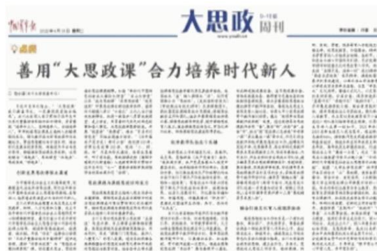
推动习近平新时代中国特色社会主义思想入耳入脑入心

一是紧紧围绕党的创新理论，推动习近平新时代中国特色社会主义思想入耳入脑入心，贯穿到思政课各门课程、各个环节；二是悉心打磨思政课程系统内容，依托高校各学段思政课程，规范系统开展世界观、人生观、价值观教育，进行历史观、民族观、国家观、文化观教育；三是创新开发课程思政特色内容，围绕人文知识、传统文化、科技前沿、大国重器开设特色课程思政。