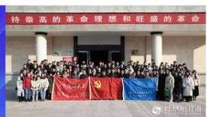
思政课进革命场馆