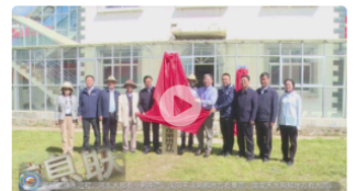
【甘肃经济频道-经济信息联播】科...