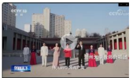
凝心聚力 扬帆远航——兰州大学艺术学院教师