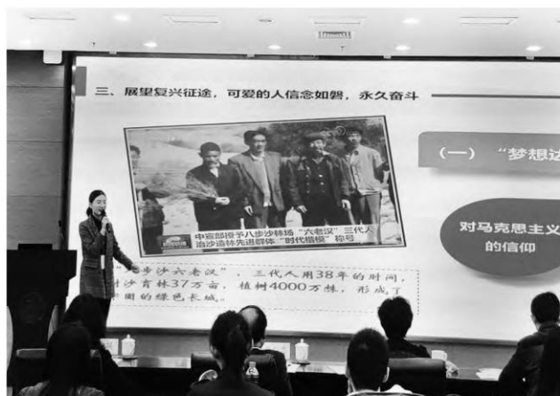
▲兰州大学“别样思政课”教学现场

习近平总书记指出：“要完善思想政治工作体系，不断创新思想政治工作内容和形式，教育