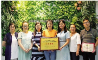
我校心理咨询中心荣获全国“大学生心理健康教育工作先进集体”称号