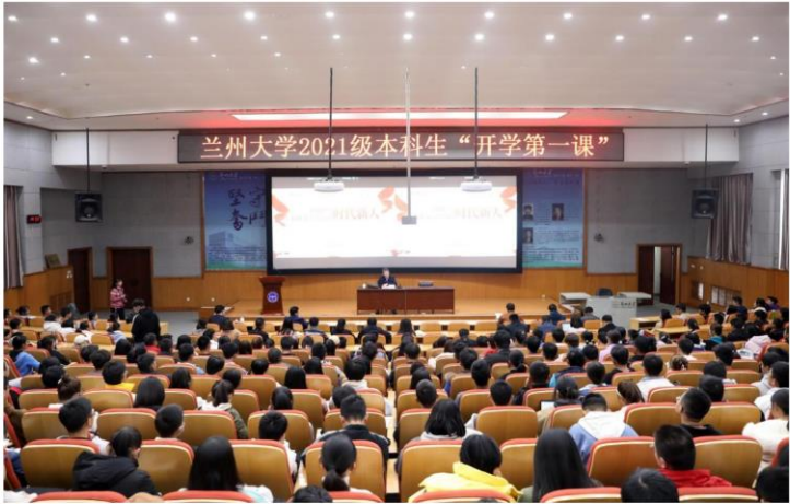
“同学们是大学生活的新人，新的生活、新的起点，也要有新的气象，希望大家矢志奋斗，不负时光，争做担当民族复兴大任的时代新人。”10月14日，兰州大学党委书记马小洁在榆中校区天山堂为2021级本科新生讲授了题为《争做担当民族复兴大任的时代新人》的开学第一课。党委常委、宣传部部长安俊堂主持“开学第一课”。

兰大首页 > 新闻网 > 校园动态 > 党建思政 > 正文 争做担当民族复兴大任的时代新人——兰州大学党委书记马小洁为2021级本科新生讲授开学第一课 日期: 2021-10-17 阅读: 2399 来源: 党委宣传部 (新闻中心)