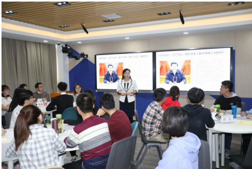
10月23日，在兰州大学城关校区西区大学生活动中心教师发展中心906室，一堂别开生面的思政