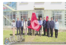
【甘肃经济频道-经济信息联播】科...