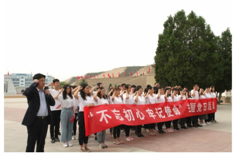
红色课堂：不忘初心，牢记使命

“政治生日是你的第二生日，党员身份是你的第一身份。希望你在今后的日子里，始终牢记党员身份、履行党员义务、践行党的宗旨、发挥党员作用，用理想之光照亮奋斗之路，以信仰之力开创光辉未来，为党和人民贡献自己的智慧和力量！”在会宁红军会师旧址，马克思主义学院党委为全体毕业生党员过了一个特殊“生日”，通过重温入党誓词、赠送“政治生日”贺卡、赠送学习教育书籍等活动，让毕业生党员深切感受到了党组织的关怀和温暖，不忘入党初心、牢记入党使命，深刻认识到作为一名党员的光荣与使命。在红军长征胜利会师纪念馆，通过一件件实物、一张张照片、一幅幅影像，全面展示了红军长征胜利的历史画卷，毕业生党员重温长征历史，缅怀革命先烈，亲身感受到长征精神的磅礴伟力。